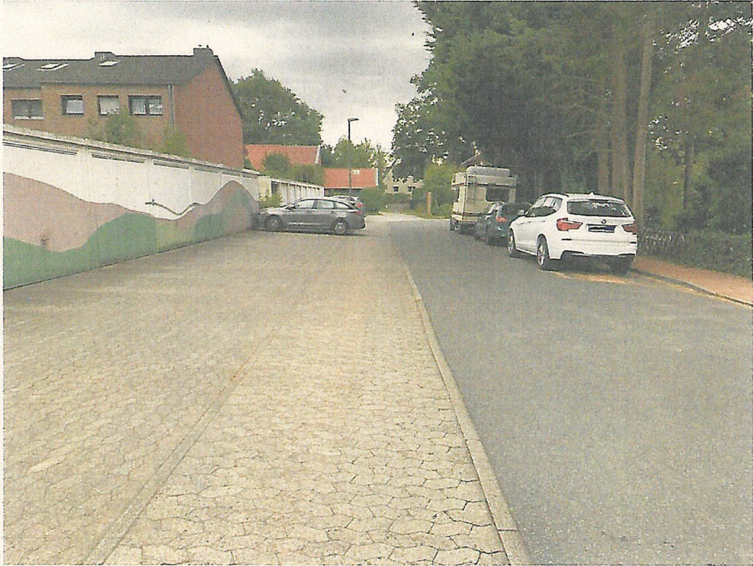
Gehweg vor den Parkflächen in der Elbinger Straße. Rechtsseitig der rot gepflasterte und erhöhte Gehweg, welcher in die Görlitzer Straße und zum Katholischen Familienzentrum Corpus Christi führt.